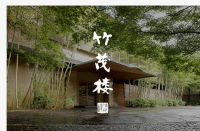
京懐石 美濃吉本店 竹茂楼